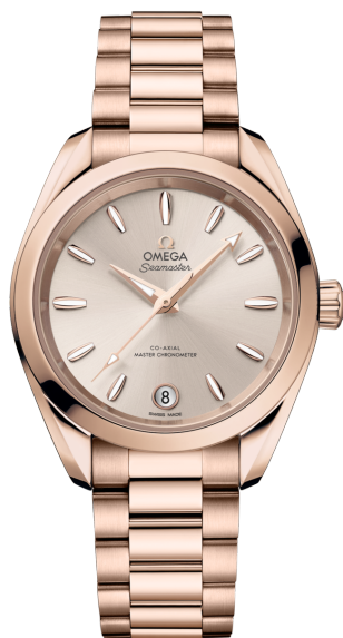
Seamaster AQUA TERRA SHADES