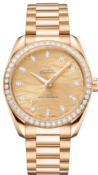
Seamaster AQUA TERRA 150M