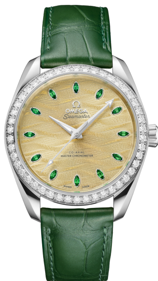
Seamaster AQUA TERRA 150M